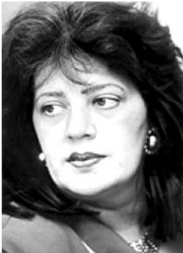
Т. Толстая «Сюжет»

Чувство, что обо всем уже сказано и написано, что создать что-то новое можно лишь проводя параллели с прошлым.